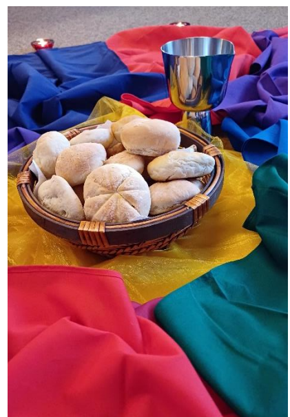
Text und Fotos: Pfarrerin Eva Thelen